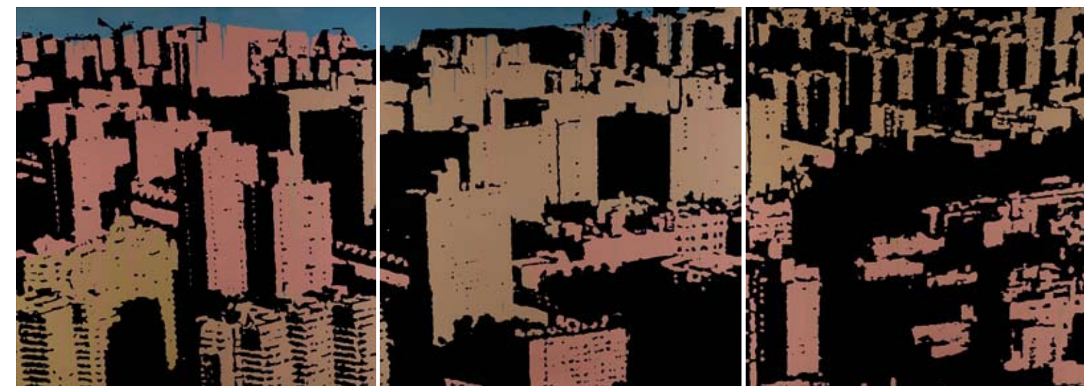
Título: “Nuclear light” / Técnica: acrílico-tela / Medidas: 360 cm x 120 cm / Año: 2006

Esta es una etapa en la cual, según explica, se daba a la tarea de racionalizar mucho cada obra: sus elementos, su composición; incluso, realizaba bocetos para cerciorarse de que todo quedara en su justo lugar. “Me permitía cierta libertad en los fondos, en los colores que utilizaba en ellos, pero a la vez, al resto del plano le daba una base de negro y sobre este aplicaba los otros tonos, porque la intención era recrear tanto las estructuras de la ciudad, con toda la verticalidad y racionalismo que ello implica, junto a las sombras que ella genera”, explicó.