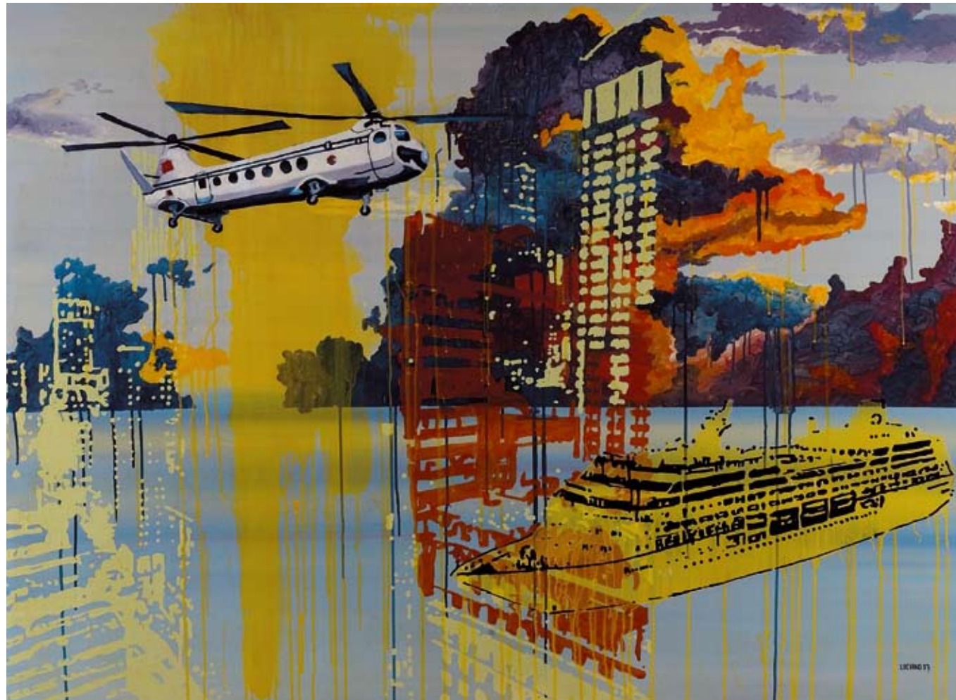
Título: "Love boat" / Técnica: acrílico-tela / Medidas: 150 cm x 120 cm / Año: 2007