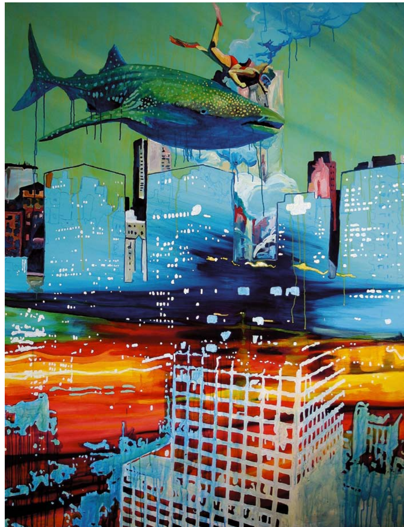
Título: "City diving" / Técnica: acrílico-tela / Medidas: 190 cm x 150 cm / Año: 2007

"Somos como una colmena de abejas, en la que cada quién realiza determinada función y luego otra y otra más, sin cuestionarse, ni saber si realmente desea hacerlo o no. Nos volvemos autómatas, como piezas de una gran máquina." Luciano Goizueta