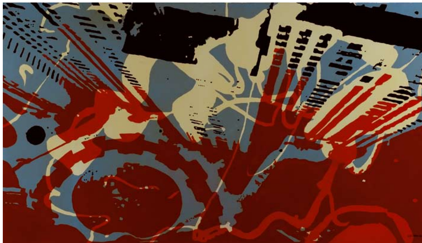
Título: "Desde el cielo" / Técnica: acrílico-tela / Medidas: 150 cm x 90 cm / Año: 2006