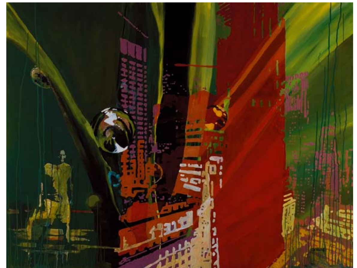
Título: "Human nature" / Técnica: acrílico-tela / Medidas: 150 cm x 120 cm / Año: 2007