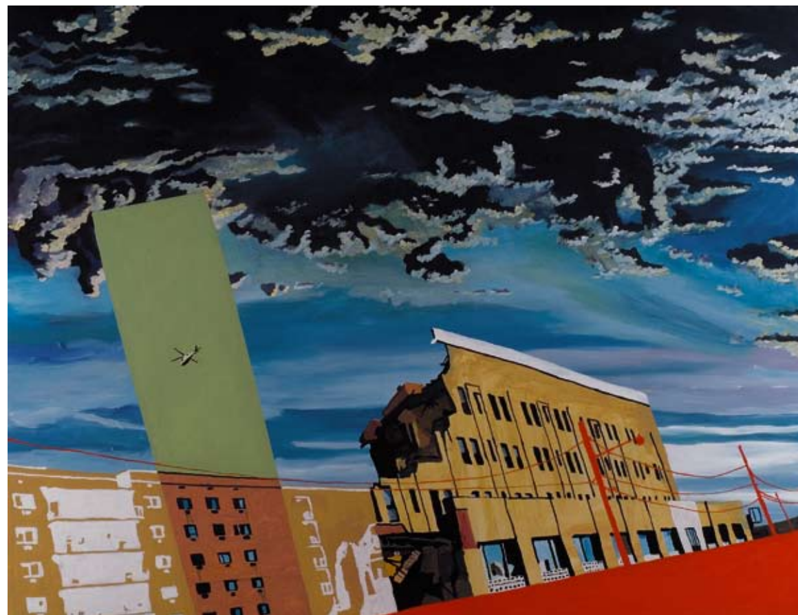
Título: "Parece que va a llover" / Técnica: acrílico-tela / Medidas: 150 cm x 120 cm / Año: 2007