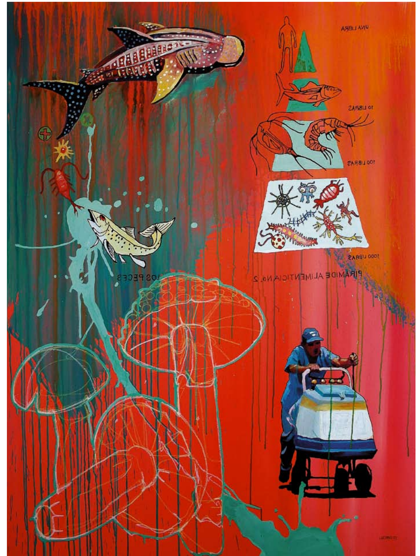
Título: "Desorden alimenticio" / Técnica: acrílico-tela / Medidas: 150 cm x 120 cm / Año: 2007