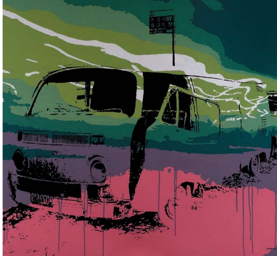
Título: "El 801" / Técnica: acrílico-tela / Medidas: 120 cm x 120 cm / Año: 2006